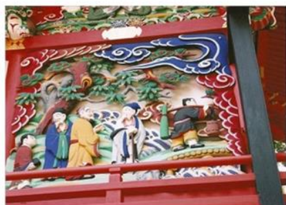
鄭據 (ていきよ) 狄兼謨 (てきけんぼ) 盧貞 (ろてい)