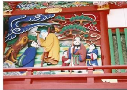
胡杲 (こか) 吉旻 (きちびん) 張渾 (ちょううん)

本殿の彫刻の題材は 香山九老 です。唐の白居易(772-846) (白楽天 一人称する時に与えられる名) が晩年に仏教を信奉して洛陽の香山寺(こうざんじ) にしばしば通いました。このように洛中(都の中)の友人と九老の会を作り香山で雅会(風流な集会)を開いて清談(俗事を避けて風流に親しむ生き方)を楽しんだ故事が香山九老です。(白楽天が74歳頃のことと言われています。)白楽天は中国文学史上李白や杜甫に次いで有名な大詩人ですが、実は唐王朝の大官僚でもありました。その文学は紫式部や清少納言を始め多くの日本の文化や文学に大きな影響を与えています。