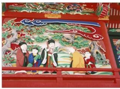
劉真 (りゅうしん) 白楽天 唐真 (りよしん)